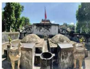
Phần mộ của Tả quân Lê Văn Duyệt và phu nhân

Phần mộ (*) có kiến trúc mộ song táng, là nơi an nghỉ của Tả quân Lê Văn Duyệt và phu nhân. Toàn thể khu mộ được xây bằng một loại vữa hợp chất. Cả hai mộ được đặt song song, có hình dạng giống nhau, như hai con rùa đang nằm úp trên bệ lớn hình chữ nhật. Phía trước mộ là một khoảng sân nhỏ để du khách làm lễ khi đến thăm viếng. Nếu từ nhà bia nhìn vào, mộ của Tả quân Lê Văn Duyệt ở phía bên phải. Bao quanh mộ là các bình phong tiền, bình phong hậu, các trụ cột, vòng bao tường xung quanh với nhiều hoạ tiết đắp nổi, trang trí truyền thống. (3)