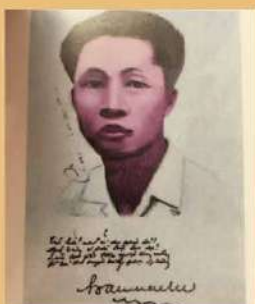
Hàn Mặc Tử

8. Nhận xét về cách tác giả cảm nhận bước đi của thời gian qua hình ảnh thiên nhiên và con người trong bài thơ.