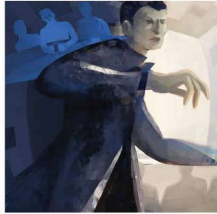
(Minh họa: Trương Thuỳ Dương)

– Xin lỗi, ông Oa-rân, tôi đã làm ông chán ngấy vì những câu hỏi ngu ngốc! Nhưng số là, chắc ông cũng rõ, trong thành phố có hai người bị giết và chẳng hiểu sao ai cũng trở nên khó tính, người ta muốn biết ai đã làm việc đó mà.