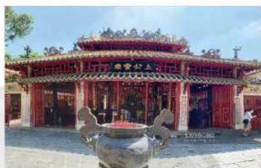
Thượng Công linh miếu

Khu miếu thờ (*) phía sau Lăng được thiết kế bao gồm tiền điện, trung điện và chánh điện, hành lang đông tây hai bên. Đây là nơi diễn ra các sinh hoạt tín ngưỡng của nhân dân trong việc thờ cúng Tả quân Lê Văn Duyệt. Mỗi gian điện thờ nằm cách nhau một khoảng sân lộ thiên, được gọi là sân thiên tỉnh (giếng trời). Công trình mang đậm dấu ấn kiến trúc miếu thờ thời nhà Nguyễn nhờ được chạm khắc gỗ, đá, khảm sành sứ tinh xảo. Hai màu sắc chủ đạo của khu vực này là đỏ và vàng. Tất cả những yếu tố đó đã làm nên sức hấp dẫn và vẻ đẹp cổ kính của khu miếu thờ. Điều đáng quý là cho đến tận hôm nay, những nét cổ xưa ấy vẫn còn được lưu giữ, bảo tồn. Trong chánh điện, tượng Tả quân Lê Văn Duyệt được đặt ở vị trí trang trọng, cao 2,65 m, nặng ba tấn và được đúc bằng đồng nguyên chất.