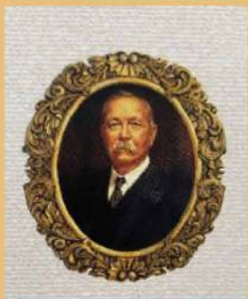
A-thơ Cô-nan Đoi-lơ (Sơ-lốc Hôm toàn tập, tập 1, NXB Văn học – Đông A, 2021)

7. Thám tử Sơ-lốc Hôm cho rằng A-thơ là chàng trai cao thượng, hào hiệp vì đã giấu cha về việc thấy Me-ry lấy chiếc mũ miện để đưa cho Gioóc Bon-queo. Em có đồng ý với nhận xét đó hay không? Vì sao?